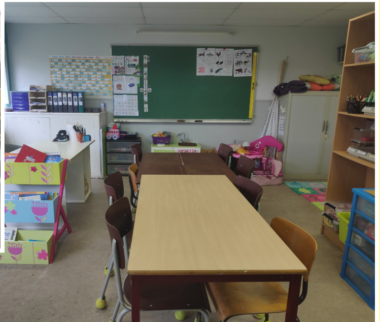
Espace de travail collectif