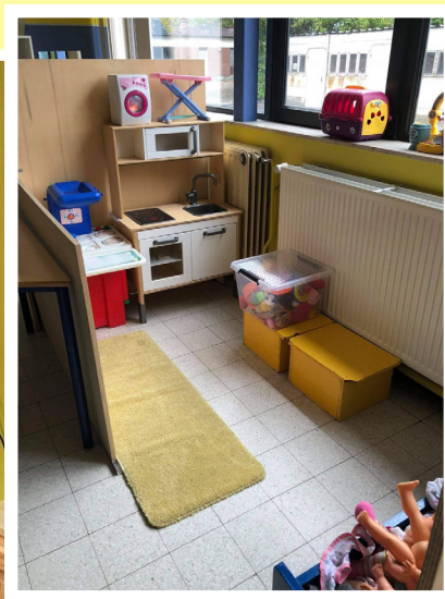
Espace de jeux